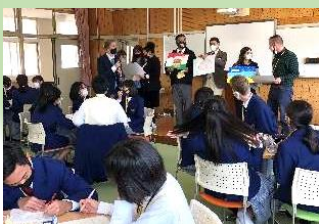
＜英語漬けの1日英語研修＞