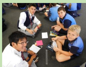
＜オーストラリアホームステイ研修＞