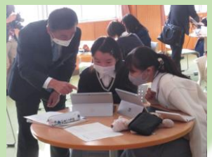
＜タブレットを使った授業＞