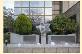
＜モニュメントと顕彰碑＞