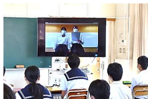
中学校での出前授業（商業）