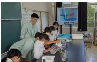
小学校での出前授業