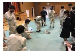
中学校での出前授業（工業）