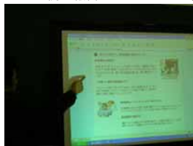
プロジェクタでインターネットの資料（警視庁HP）を表示

最後に、危機管理意識の醸成も重要であることを強調したい。また、スクールカウンセラー、地域の方々、学校評議員など外部の方の参加により、より研修効果の上がった例も報告されているので、是非試みていただきたい。（校内研修会事例集 平成16年4月山口県教育委員会）